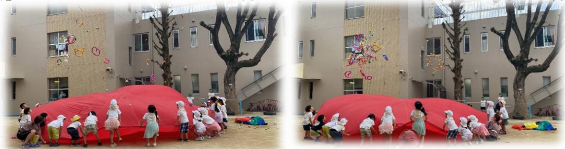
☆19日にひじり tube『花火』を配信予定

『花火』のパフォーマンスだけはすぐに見てもらいたい!!というしろ組さんの思いを届けます!!